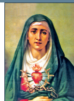
Virgen Dolorosa del Colegio