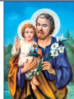
San José, esposo de la Virgen María