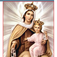
N. Señora del Carmen