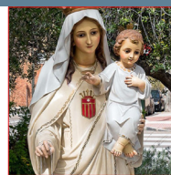
Virgen de La Merced