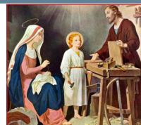
Sagrada Familia: Jesús, María y José