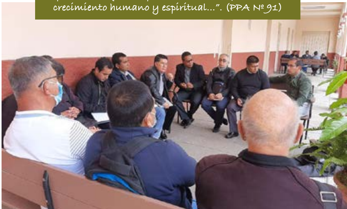
Reunión del Clero

“Se constata que se han creado espontáneamente grupos de presbíteros que comparten ambientes fraternos, un crecimiento humano y espiritual...”. (PPA N° 91)