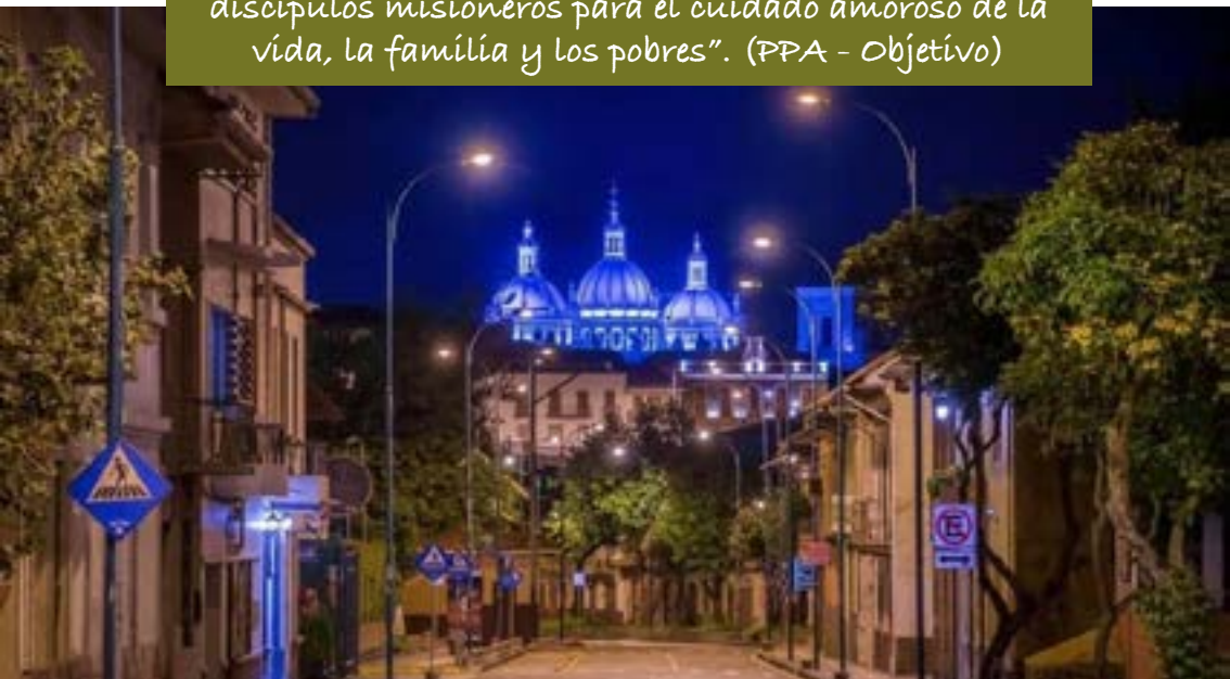
Vista nocturna a la Catedral

“Ser Iglesia en salida que acoge la gracia de la conversión permanente: personal, comunitaria, pastoral e institucional, que vive el Evangelio y forma discípulos misioneros para el cuidado amoroso de la vida, la familia y los pobres”. (PPA - Objetivo)