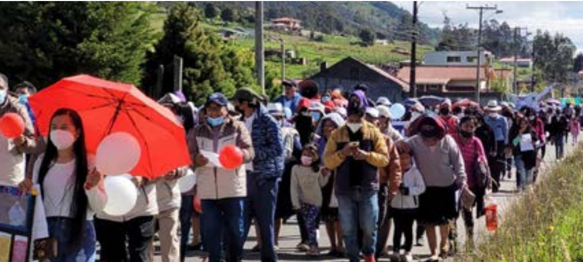
Marcha por la Fiesta de la Vicaría Suburbana

En este contexto sinodal, la experiencia de Iglesia en salida nos ha permitido encontrarnos con los hermanos más necesitados, en las periferias existenciales, así: adultos mayores, niños, jóvenes, familias, migrantes, refugiados, grupos étnicos, minorías sociales, entre otros, en actitud de apertura, caridad y parresía, como un espacio de escucha, discernimiento y compromiso con la Palabra, haciendo que todos nos sintamos discípulos misioneros. (Síntesis Final N° 2)