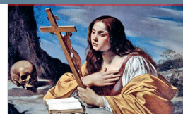
Santa María Magdalena