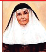
Santa Ángela de la Cruz