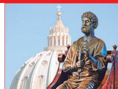
Cátedra de San Pedro