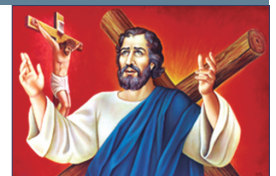
San Andrés, Apóstol